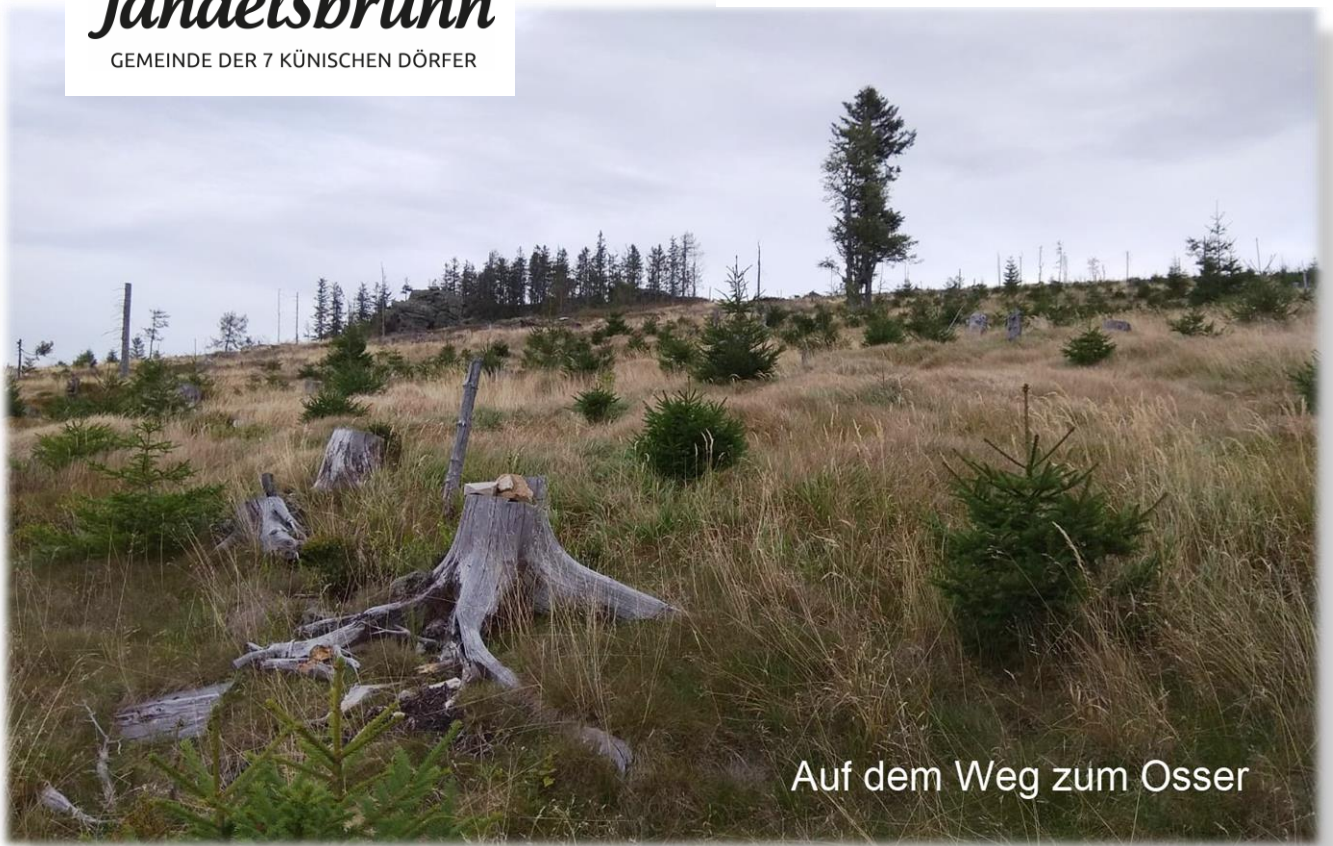
Auf dem Weg zum Osser