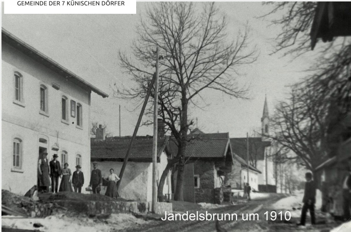
Jandelsbrunn um 1910